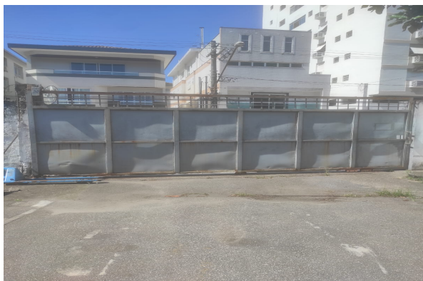
(Imagem 1 - Vista do portão antigo)

5.1.2. A CONTRATADA deverá retirar o portão antigo com todo gerenciamento e acompanhamento técnico da execução; no local o antigo portão deslizava sobre trilho específico para o portão de aço.